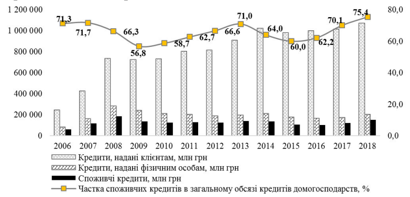
Рисунок 1 – Обсяги споживчого кредитування та їх частка у загальному обсязі кредитування домогосподарств за 2006–2018 рр, млн грн [1]

Аналіз стану кредитування банками в Україні домогосподарств наведено на рис. 1.