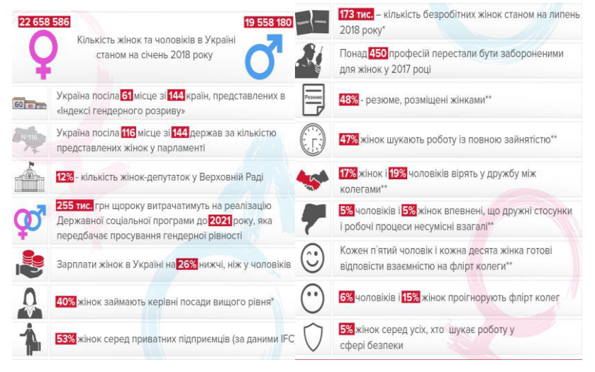
Участь жінок у трудових відносинах

Крім того, дані Світового банку показують, що у період останньої кризи заробітна плата жінок девальвувала більше, ніж зарплата чоловіків: заробітна плата чоловіків у 2015 році становила 87,7 % від заробітної плати 2013 року, тоді як заробітна плата жінок становила 77,3 % від показника того ж року [1].