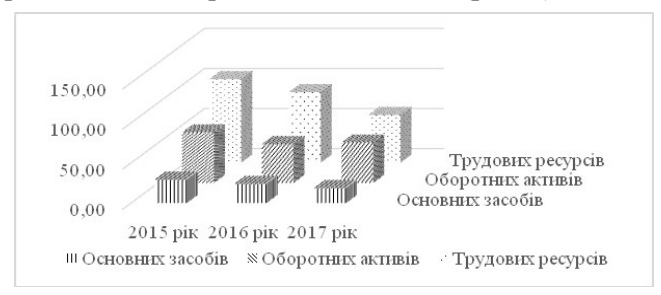
Рисунок1 – Динаміка показників рентабельності ПРАТ «Домінік» за 2015–2017 рр., %.

Як зазначається у працях Л. М. Духновської, В. С. Павлова, управління прибутковості представляє собою систему принципів та методів розробки і реалізації управлінських рішень, які мають на меті належне формування, розподіл та використання прибутку суб'єкта господарювання [1]. Аналіз прибутковості та рентабельності ПРАТ «Домінік», основним видом діяльності якого є виробництво та реалізація кондитерських виробів, свідчить про тенденції скорочення показників (рис. 1).